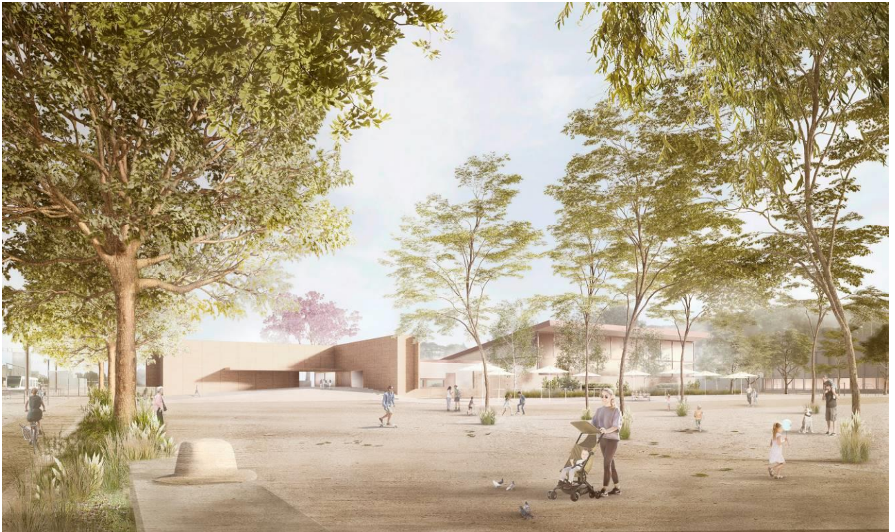
Aussenvisualisierung Hallenbad Buechenwald

Planmässig erfolgte Ende April 2019 die Wettbewerbsausschreibung «Fussballtribüne Buechenwald». Ende 2019 wird der Projektwettbewerb «Fussballtribüne Buechenwald» juriert. Der Auftrag soll dem siegreichen Architekturbüro übertragen werden. Fachplaner, welche einen substanziellen Beitrag zum Wettbewerb geleistet haben, sollen ebenfalls mit der Weiterbearbeitung beauftragt werden.