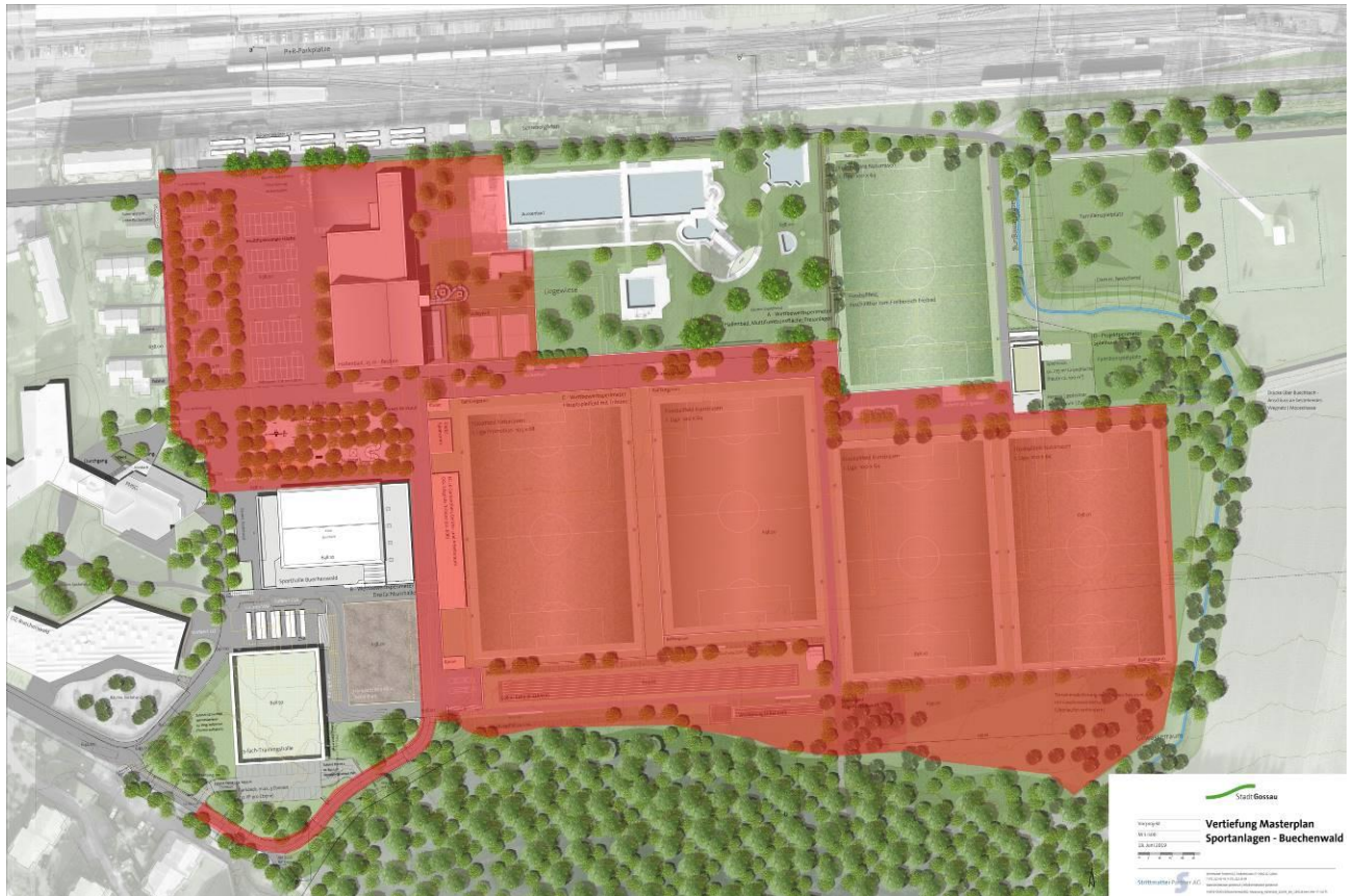
■ Bearbeitungsperimeter, Modul 1, Buechenwald

Das «Modul 1 Buechenwald» beinhaltet Neubau Hallenbad, Anpassung Freibad, Neubau Tribüne, Leichtathletikanlagen, vier Fussballplätze, Plätze, Parkplätze, Erschliessungsstrassen und Umgebung. Es ist nicht weiter unterteilbar. Die Umsetzung der Fussballplätze und der Tribüne sowie der Bau des Hallenbades auf dem heutigen Hauptfussballfeld sind direkt voneinander abhängig.