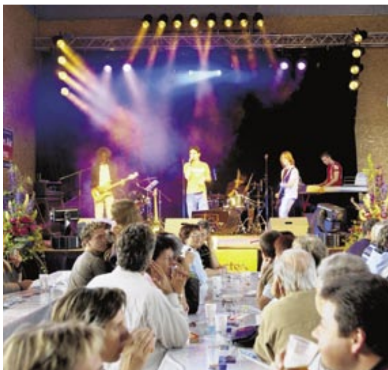
«Treff 13» am 13. jedes Monats ab 19.13 Uhr.

Weitere Informationen: Verein Gossau plus 9201 Gossau E-Mail: info@gossauplus.ch Internet: www.gossauplus.ch