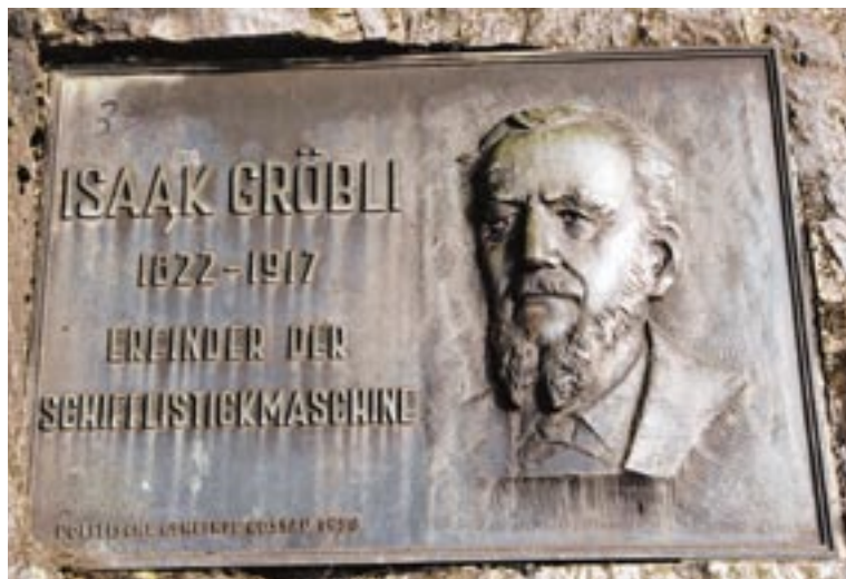
Erfinder Isaak Gröbli lebte einige Jahre in Gossau

Gemessen an der Einwohnerzahl, hätte sich Gossau schon in den 70er-Jahren als Stadt bezeichnen können. Es blieb aber im Ortsbild und im Selbstverständnis der Einwohnerschaft lange ein grosses Dorf. Erst gegen Ende des 20. Jahrhunderts wurde vermehrt von Stadt gesprochen. Erst mit der Verschmelzung der Politischen Gemeinde und der Schulgemeinde zur Einheitsgemeinde auf den 1. Januar 2001 nannte sich Gossau offiziell Stadt.