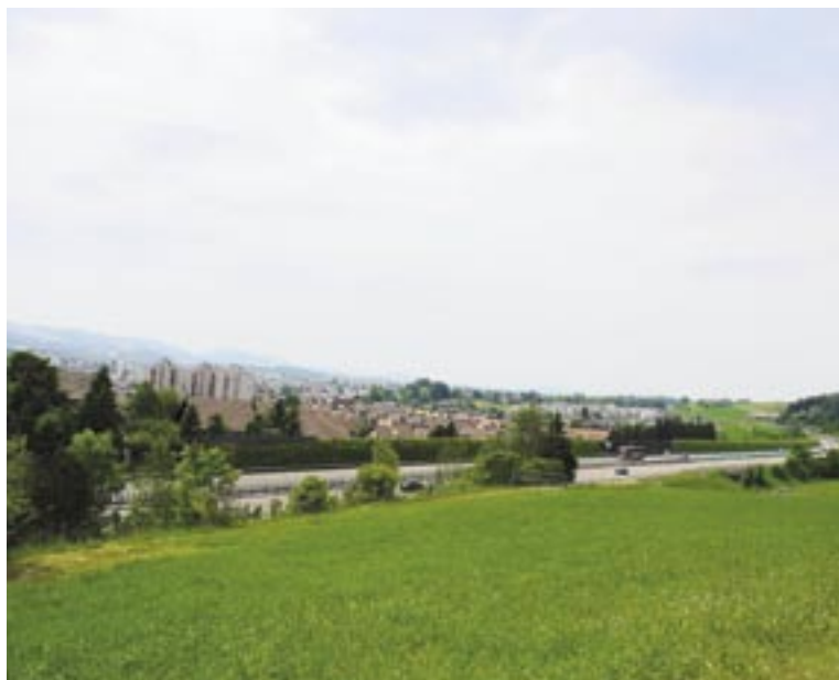
Verkehr als Chance: Gossau profitiert von seiner guten Lage.