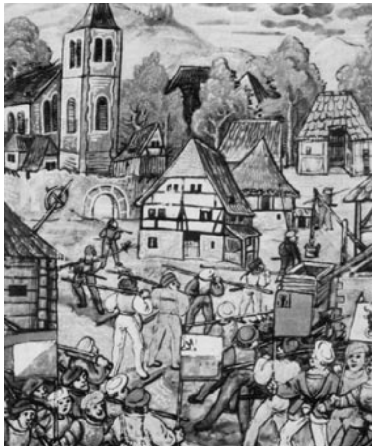
Im Jahr 1490 suchen eidgenössische Truppen Gossau heim.