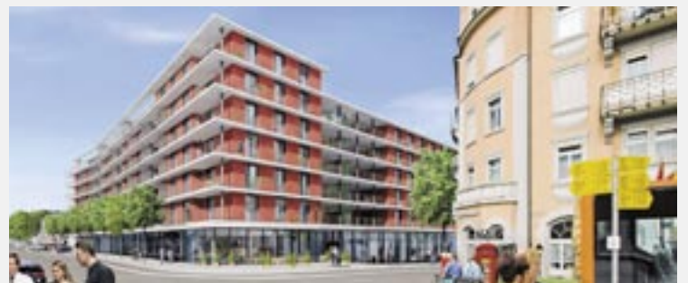
Das «Neustadt-Zentrum Gleis 2» wird das Bild des Gossauer Bahnhofplatzes verändern.

Das Gesicht des Bahnhofplatzes wird sich markant verändern, wenn die geplante Gewerbe- und Wohnüberbauung beim Bahnhof realisiert wird. Im Stadtentwicklungskonzept wird das nördlich an den Bahnhof angrenzende Gebiet als Neustadt bezeichnet. Hier soll mit grossmassstäblichen Bauten ein urbanes Gebiet für Dienstleistungen, Freizeitaktivitäten und städtisches Wohnen entstehen. Zentrales Projekt hierfür ist ein Neubauprojekt auf dem Areal der einstigen Butterzentrale. Die geplante Überbauung «Neustadt-Zentrum Gleis 2» sieht im Erdgeschoss rund 1500 Quadratmeter für Läden, Dienstleistungen und Gastro-