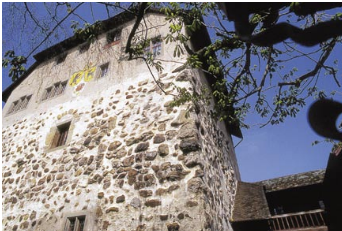
Das Schloss Oberberg war Gerichtssitz und Vogt-Residenz.

Im 20. Jahrhundert hat sich Gossau zum Wirtschaftsstandort entwickelt, mit einem Schwergewicht in der Nahrungsmittel-