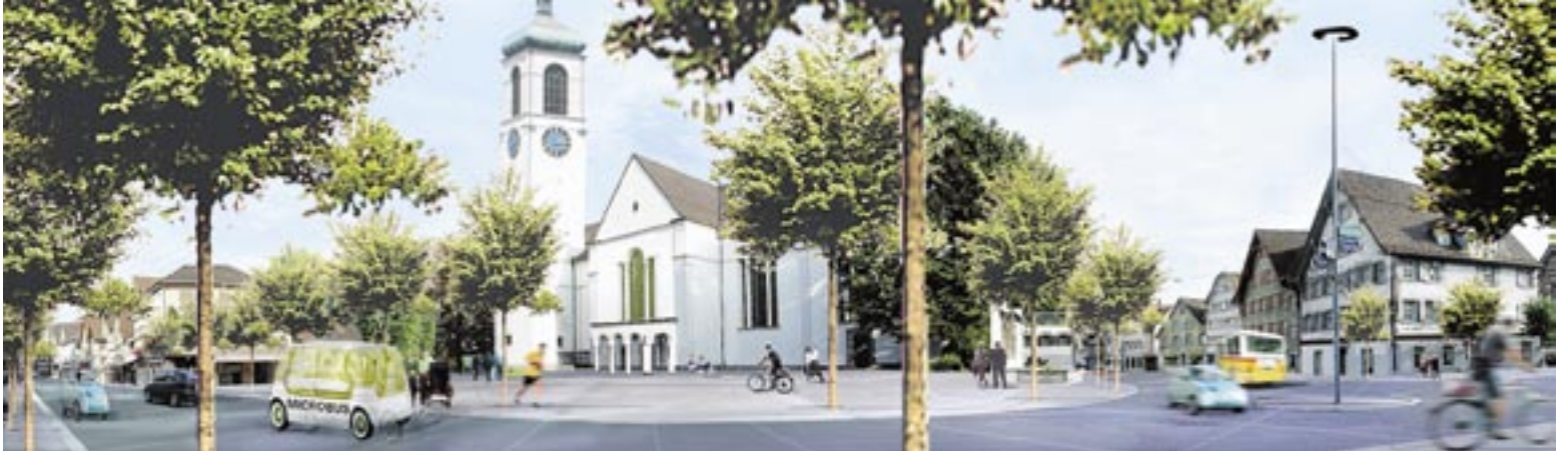
Der Gossauer Kirchplatz in 20 Jahren, grün und verkehrsarm?

Das Gossauer Zentrum droht an Bedeutung zu verlieren. Um dies zu verhindern, sollen bestehende Nutzungsmöglichkeiten gestärkt und neue entwickelt werden. Die Grundlage bildet das im September 2004 beschlossene Stadtentwicklungskonzept.