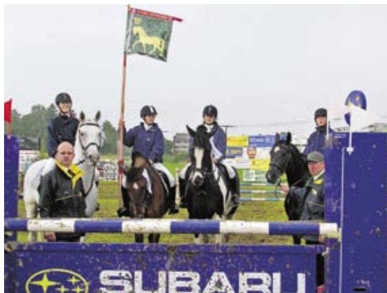
Die Equipe des Kavallerie- und Reitverein Gossau erreichte am CS-Gossau 2005 den 1. Rang in der Qualifikationsprüfung zum Subaru-Cup.

Sechs Kavallerierekruten haben sich 1906 für die Gründung des Kavallerievereins Gossau eingesetzt. Dies obwohl in Gossau bereits ein Reitclub bestand. Die Kavalleristen wollten sich nicht von den «noblen Herren und hochrangigen Militärs» bevormunden lassen. Trotz Widerstand aus deren Kreisen setzten sich die Initianten durch und gründeten an der ersten Versammlung am 16.2.1906 den neuen Verein. Bereits 1915 wurde im Namen auch die «Umgebung» eingeschlossen, um Mitglieder aus den Nachbargemeinden aufzunehmen. Mit der nahenden Abschaffung der Kavallerie wurde 1964 eine zweite Namensänderung notwendig, damit private Reiter aufgenommen werden konnten. So entstand der «Kavallerie und Reitverein Gossau und Umgebung», der heute rund 160 Ehren-, Frei- und Aktivmitglieder zählt.