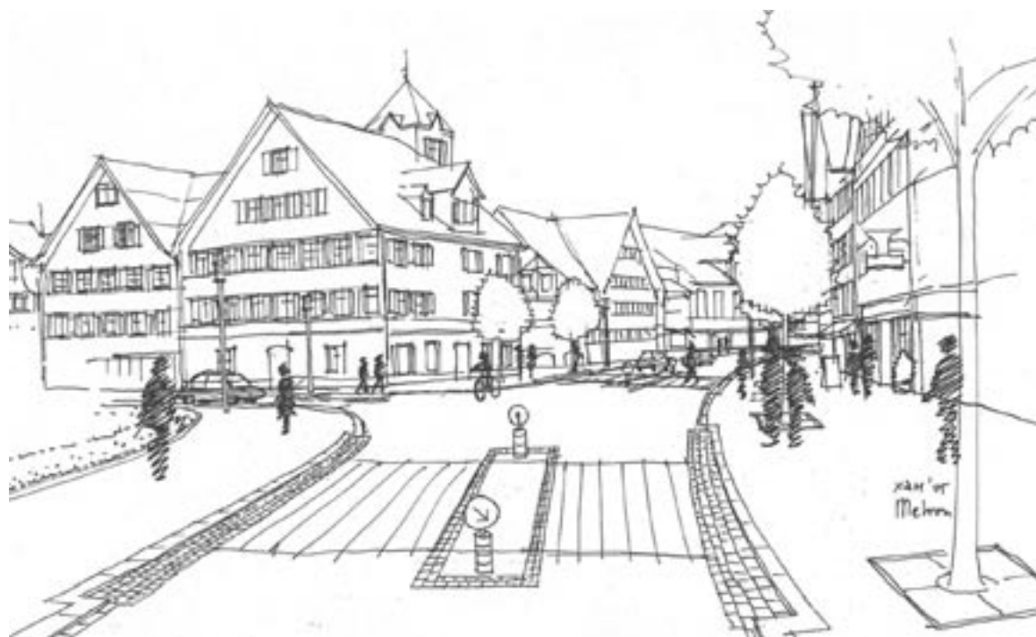
Die Flächen der A St.Gallerstrasse sollen gerechter auf alle Verkehrsteilnehmenden verteilt werden.