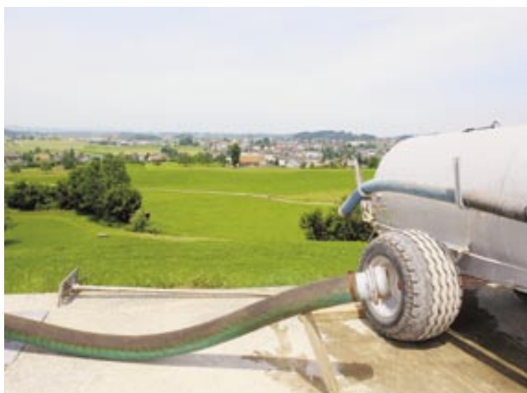
Schöne Aussichten: Im Gossauer Westen entsteht viel Neues.